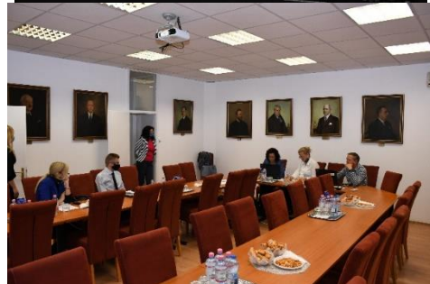
A 2020. október 8-án megtartott online nyitókonferencián a Miskolci Jogi Kar Eperjes Termében készült képek.